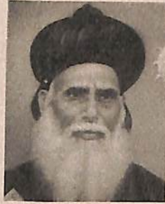
പ. മാത്യു മിശിയാസ് ഗീവർഗ്ഗീസ് പ്രമുഖൻ കാതോലിക്കാ ബാവ